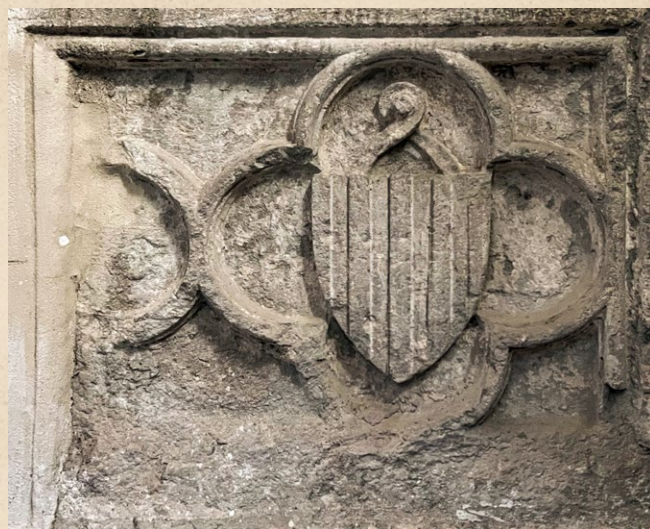
Cattedrale di Oristano. Battistero. Pali catalani (prima metà secolo XIV)